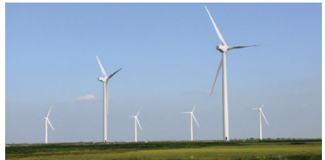
大都會人壽持有35個風力和太陽能農場的所有權利益，所產生的潔淨能源總量，足夠多達130萬戶家庭使用。